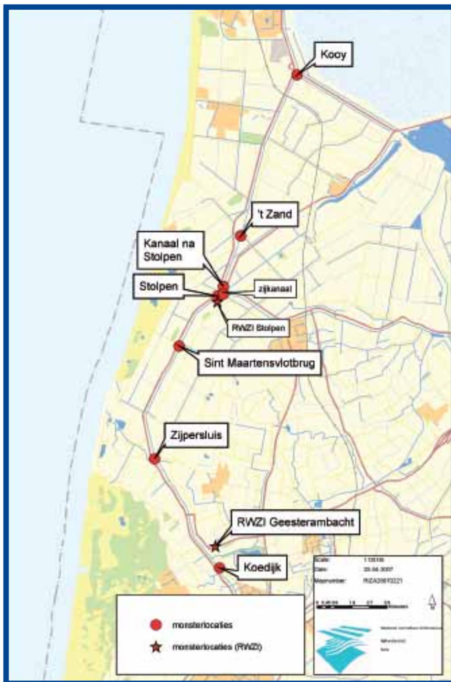
Afb. 1: Bemonsterde locaties in het Noordhollandsch Kanaal.

Afbeelding 2 toont de resultaten van de uitgevoerde testen van de eerste bemonstering in het oppervlaktewater. Een toename in toxiciteit is te zien tussen het eerste en tweede bemonsteringspunt voor de watervlo en in mindere mate voor algen. De toxiciteit verdwijnt daarna weer uit het watersysteem. Naar aanleiding van de resultaten van de eerste bemonstering is op 24 oktober een tweede bemonstering uitgevoerd. Hierbij is het aantal locaties uitgebreid, zodat nauwkeuriger bepaald kon worden waardoor de eerder vastgestelde verschillen in effectniveaus veroorzaakt werden. Tevens zijn de effluënten van de rwzi's Geestmerambacht en Stolpen bemonsterd. Beide zuiveringen lozen direct op het Noordhollandsch Kanaal. Geestmerambacht is veruit de grootste van deze twee zuiveringen. De bemonsterde locaties zijn terug te vinden in afbeelding 1.